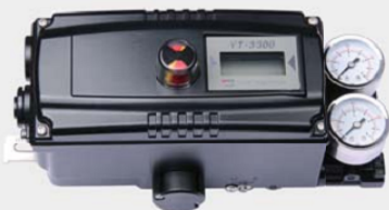
YT-3300R + 限位开关